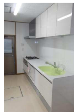
システムキッチン