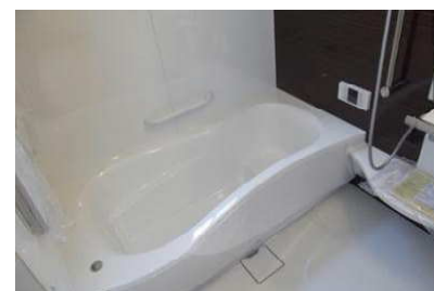
システムバス(1坪タイプ)